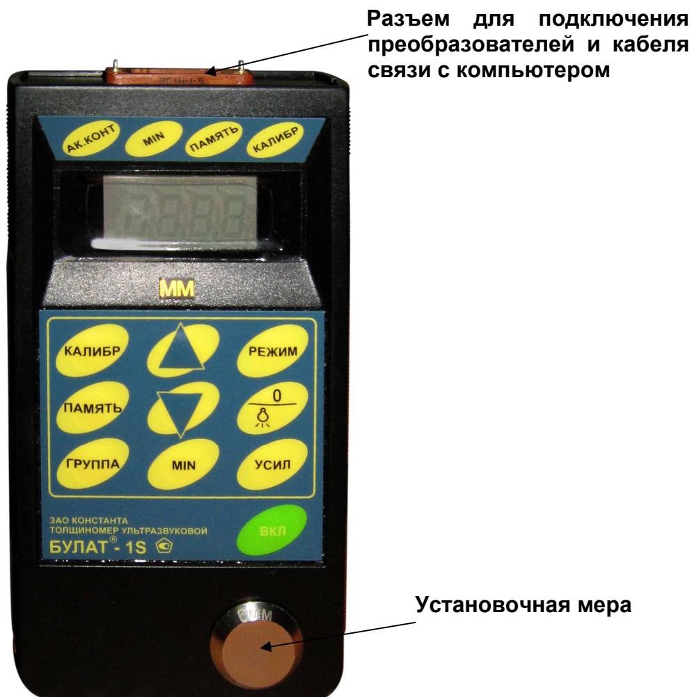
Рис.1. Булат 1S

Расположение клавиатуры и индикатора на лицевой панели блока обработки информации прибора приведено на рисунке 1.